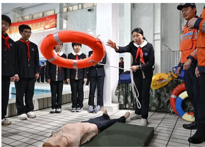
同学们学习救生圈救援和心肺复苏技巧。