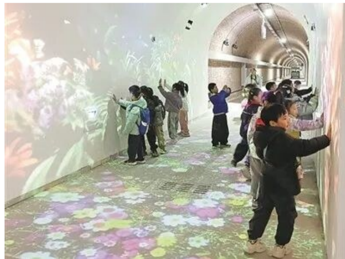
在河北省石家庄市通山人防工程内，一群儿童观看“灯光秀”。