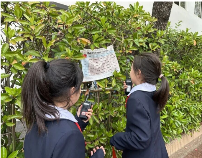
同学们根据应急救援物资调度清单寻找物资。

近日，上海市（虹口区）青少年国防人防海防教育集中展示活动在全国国防教育示范学校——上海市民办新华初级中学顺利举行。