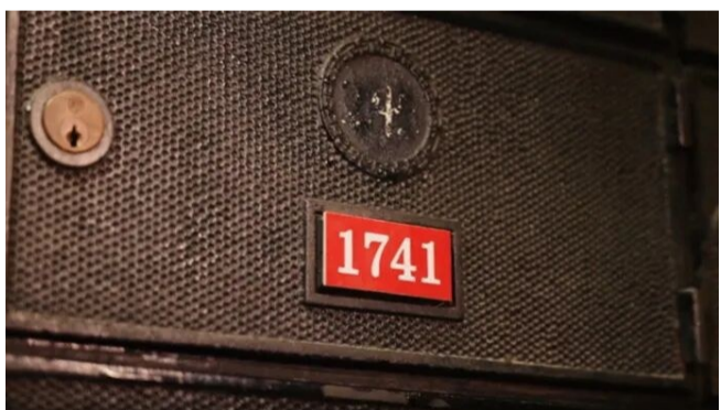
中共上海邮局总支曾用于秘密通信的1741号租用信箱