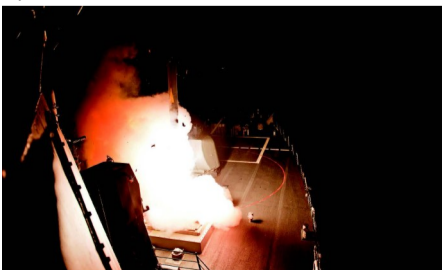
美制“战斧”巡航导弹

目前世界各国主要的巡航导弹有：俄罗斯和印度联合研制的“布拉莫斯”反舰导弹、中国的鹰击-18反舰导弹、美国AGM-129隐身巡航导弹、俄罗斯的3M-54反舰导弹、欧洲风暴阴影巡航导弹、英法意联合研制的“斯卡普EG”巡航导弹、美国的“战斧”巡航导弹等。