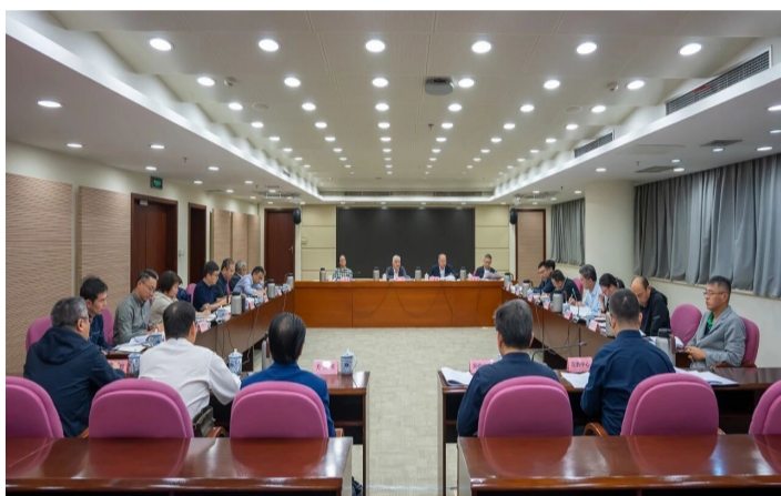
《上海市人民防空防护设备管理实施办法》会议决策现场

近日，市国动办邀请本市人民防空防护设备领域的生产从业者、施工监理代表、资深法律专家列席主任办公会，共同参与《上海市人民防空防护设备管理实施办法》（以下简称《实施办法》）会议决策。