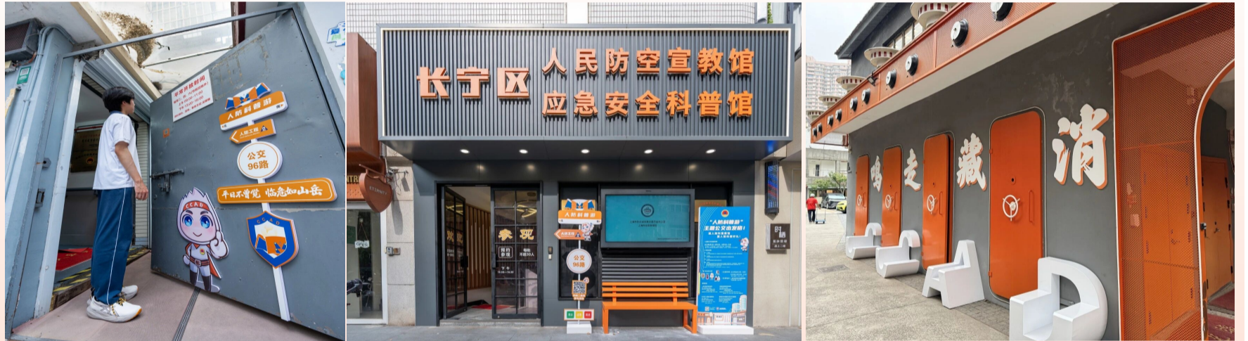
黄浦区民防教育培训基地、长宁区人民防空宣教馆和普陀区M50民防文化艺术创意馆现场照片

活动通过公交线路串联市区两级人防展馆，包括黄浦区民防教育培训基地、长宁区人民防空宣教馆和普陀区M50民防文化艺术创意馆，将人防知识融入城市动脉。人防科普主题公交恰如行走的“宣传大使”，充分带动市区展馆曝光量，形成“以线带点、馆际联动”的聚合效应。据统计，活动期间展馆参观人次同比增长近100%，开拓市区人防科普展馆联动的新篇章。