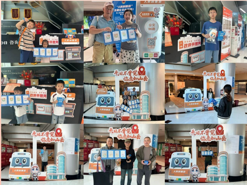
市民现场打卡照片

本次活动构建“公交+打卡+互动”新模式，引导市民乘主题公交沿途参观人防展馆，完成馆内集章、人防答题与合影打卡等互动环节后，即可兑换宣传品。参观结束，市民们将展馆打卡照片分享至社交平台，收获颇丰。“人防科普游”带领市民们开展了一场“城市探秘之旅”，将静态的人防知识转化为动态的科普体验，增强参与感与趣味性，实现“寓教于乐”的宣传效果。